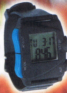
PM 600 OS