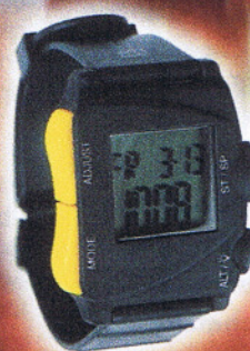
PM 800 OS